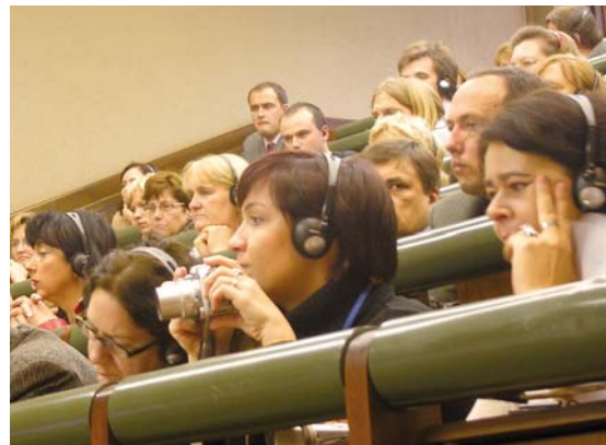
Zasłuchane Polki na Łotwie – Uniwersytet Stradins, Ryga