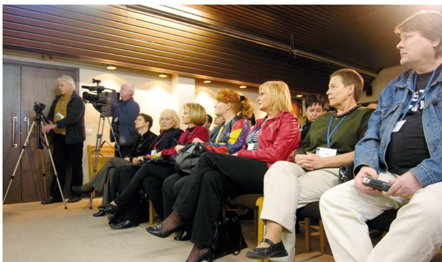
Instytut Polski w Sztokholmie – płynęły z nami także telewizje