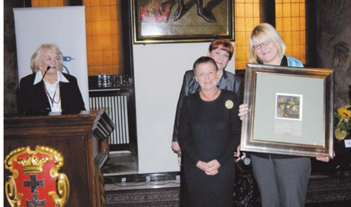
GlaxoSmithKline odbiera tytuł Wielkiego Edukatora przyznany przez Stowarzyszenie „Dziennikarze dla Zdrowia”