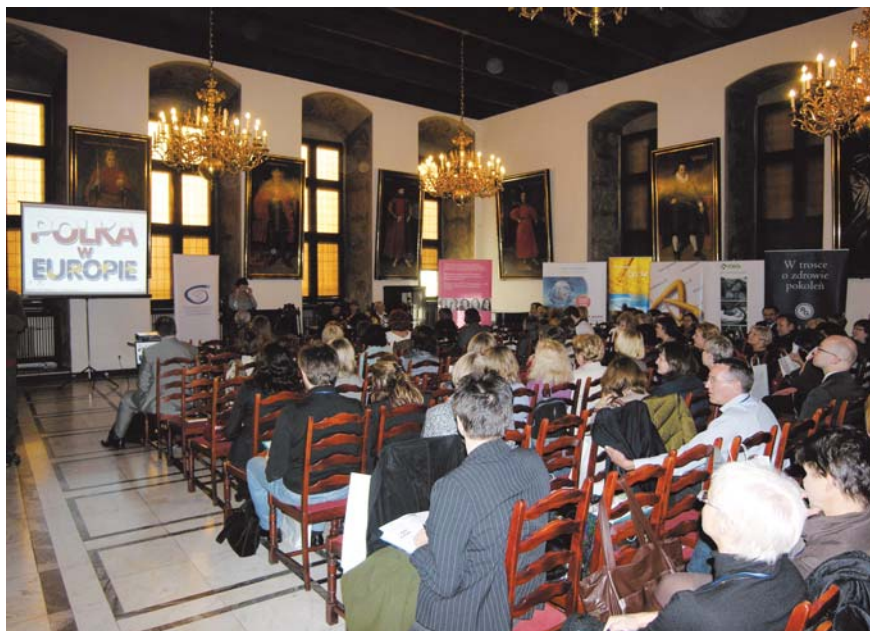
Sala Wety była pełna – uczestnikom seminarium towarzyszyły trójmiejskie media

muzykoterapii przygotowany przez firmę SymPhar, która regularnie wspiera przedsięwzięcia artystyczne i łączy je z medycyną. Brawurowy koncert muzyki klasycznej w wykonaniu kwartetu smyczkowego Nowa Orkiestra Kameralna znakomicie wpłynął na nastroje – uczestnicy mogli się przekonać jak pozytywne może być takie doświadczenie dla pacjentów w szpitalu. Dzięki prezesowi Lucasowi, tylko latem tego roku blisko 400 chorych mogło wysłuchać takich koncertów – niemal wszy-